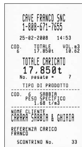
Scontrino di stampa

helper7 fa dell'integrazione il suo punto di forza. Include nella sua unità una stampante ed un lettore per il trasferimento dei dati di carico su ikey, una memoria tascabile. Il concetto del tutto in uno di helper7 completa il tuo mezzo e agevola la gestione del tuo lavoro.