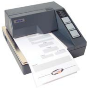
Stampante a talloncino, Epson (opzione)