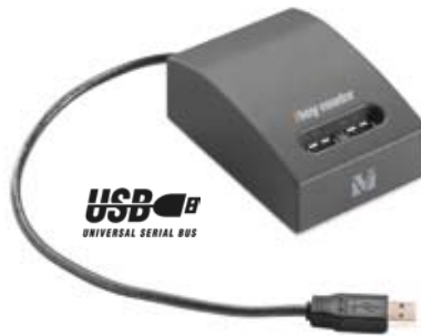
ikey reader, lettore memoria tascabile