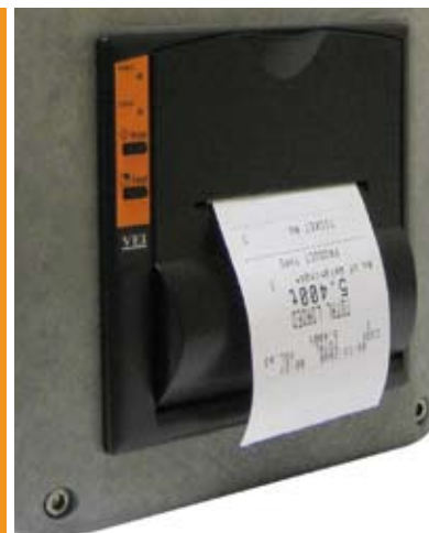
Stampante termica ad alta velocità