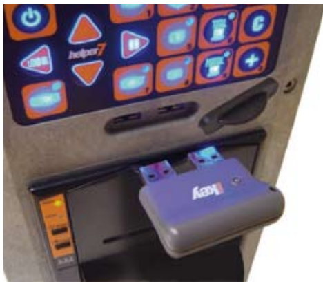
ikey, memoria tascabile