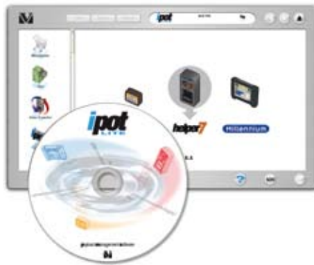
ipote Lite, software per la gestione dei carichi