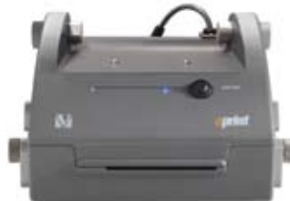
eprint , impresora térmica rápida de gran resistencia