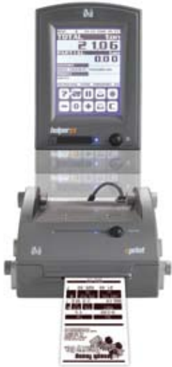
Ticket de ejemplo