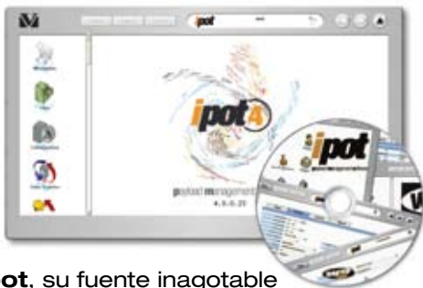
ipot , su fuente inagotable de gestión de cargas útiles