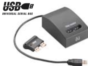
ikey , memoria de bolsillo y lector de ikey USB