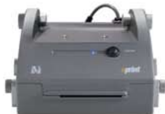
eprint скоростной и надежный термопринтер