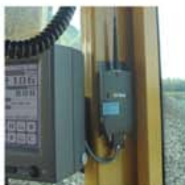
Радиочастотный передатчик для передачи данных на короткие расстояния