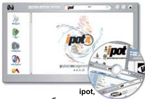
ipot, программное обеспечение для обработки данных