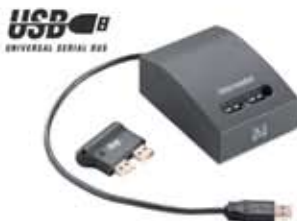
карта памяти Ikey и USB считыватель