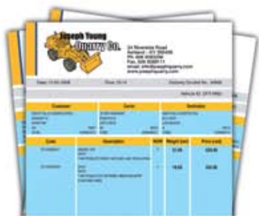
Настройка печати документов