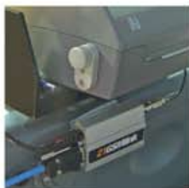
21 GSMlink. Передача данных через GPRS сотового оператора