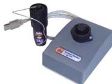
DLogger pamięć przenośna i czytnik pamięci ze złączem USB (opcja)