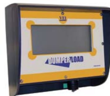
Zewnętrzny wyświetlacz obciążenia po jednym z każdej burty (opcja)