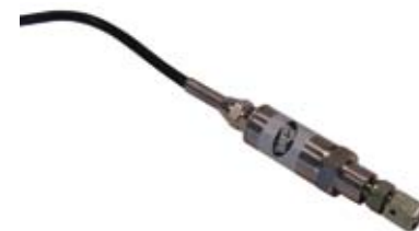
Czujnik obciążenia dla każdego zespołu zawieszenia