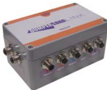
Urządzenie łącznościowe Dumper Load Link