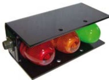
Zewnętrzne sygnalizatory świetlne stanu załadunku po jednym z każdej burty (opcja)