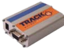
TRACK WEIGHT MOBILE Draadloze transmissie met cellulair modem TrackWeight Mobile