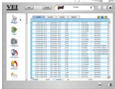
ipot , uw eindeloze bron van verladingsbeheer