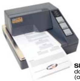
Slip printer dot-matrixprinters (optie)