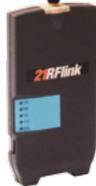
Draadloze transmissie op radiofrequentie met 21RFlink