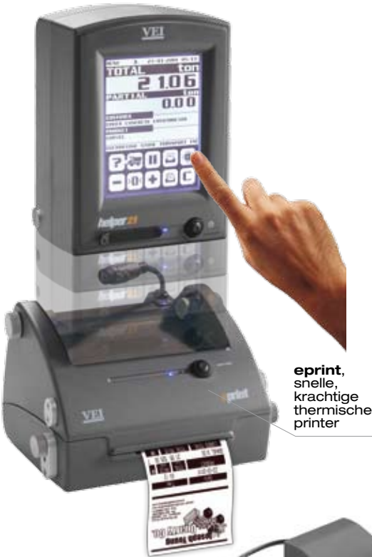
Voorbeeld van weegbon