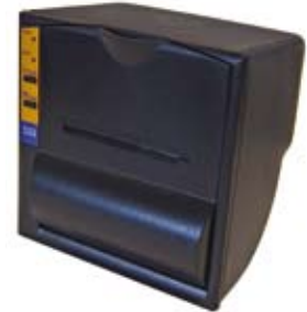
High speed thermische printer (optie)