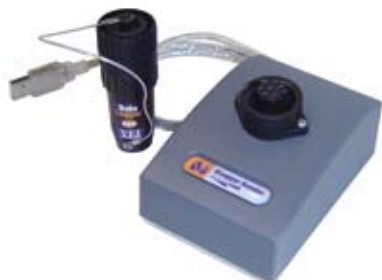
DLlogger memorstick en USB DLlogger reader (optie)