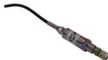
De druksensors , voor elke kant