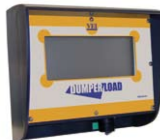
Display met externe lastindicatie (optie)