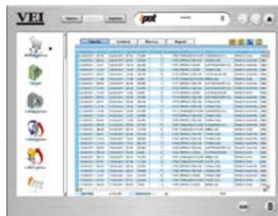
ipot, la vostra fonte per la gestione dei carichi