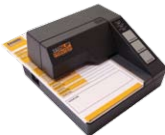
Slip printer stampante ad aghi (opzionale)

eprint, stampante termica resistente e rapida per stampa DDT