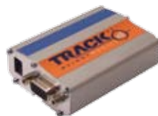
TrackWeight Mobile modem cellulare quad-band