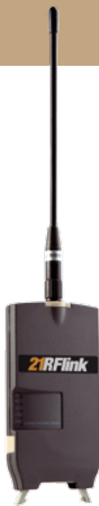
21RFlink radio modem