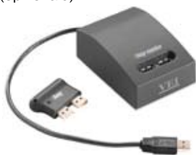
ikey memoria tascabile e lettore ikey reader