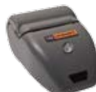
Sprint stampante termica (opzionale)