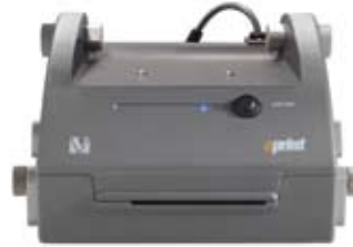
eprint , hurtig, robust termoprinter