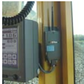
21RFLink radiofrekvens, trådløs overførsel