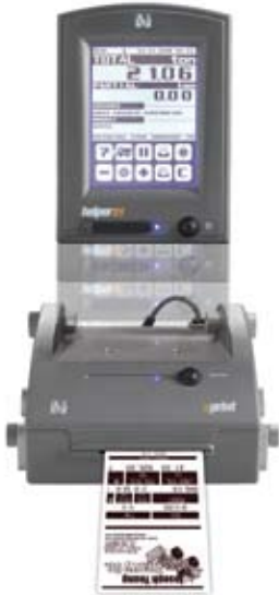
eksempel på bon