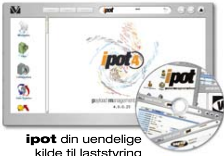
ipot din uendelige kilde til laststyring