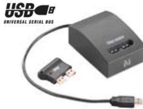
ikey hukommelsesnøgle og USB-ikey reader