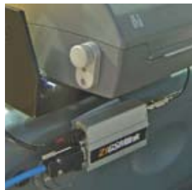
21GSMLink modem, trådløs overførsel