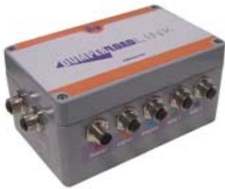
Dumper Load Link inputanordning