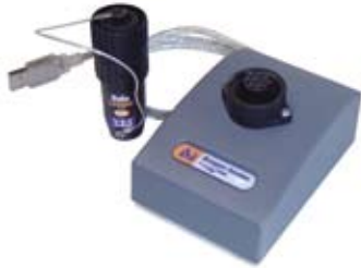
DLlogger dataoverførselsæt (ekstraudstyr)