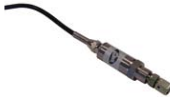
Lastfølere , én på her affjedring