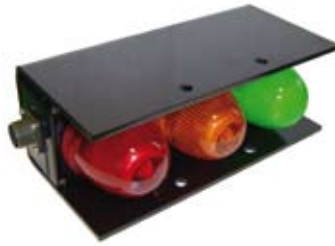
Eksterne indikatorer fo læsning, én på hver side (ekstraudstyr)