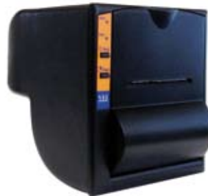
Termoprinter med høj hastighed (ekstraudstyr)

Alsidigt og fuldautomatisk - sikrer at vippeladsvognen anvendes i overensstemmelse med sine designstandarder. Forebyggelse af overlæs medfører lavere vedligeholdelsesomkostninger og mindre dækslid - vigtige overvejelser, når man styrer en flåde af vippeladsvogne. Instrumentet kan også anvendes til transmission af laststatus for at optimere fordelingen af flåden i en mine. Korrekt fordeling af flåden reducerer uproduktiv ventetid og letter beslutningstagningen med hensyn til udskiftning. Det er helt klart et uundværligt værktøj, der sikrer pålidelige data og fjerner alle spørgsmålstejn.