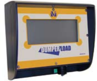
Eksternt display med læsseindikator (ekstraudstyr)