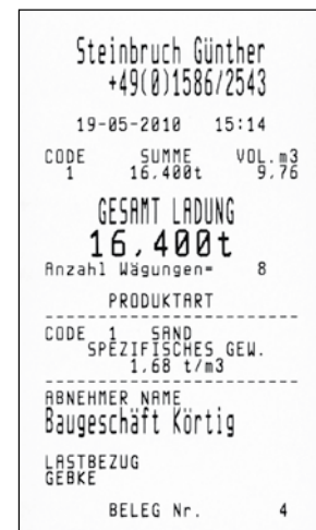
Beispiel für eine Wiegenote