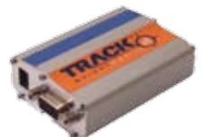
TrackWeight Mobile Modem, Quad-Band-Mobiltelefon