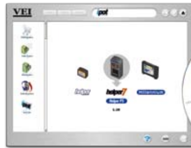
Software zur Nutzlastverwaltung ipot Lite