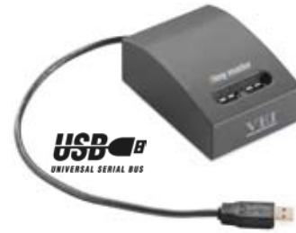
iskey reader USB