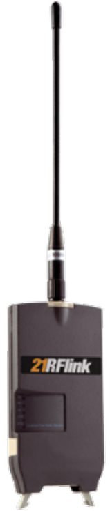
21RfLink Modem-Radio 868 MHz